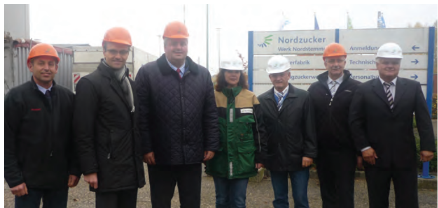
Burkhard Balz mit Vertretern der Nordzucker AG

Auf Einladung der Nordzucker AG besuchte der Europaabgeordnete Burkhard Balz die Raffinerie des Unternehmens am Standort Nordstemmen und traf sich mit Vertretern des Unternehmens zu einem gemeinsamen Gespräch. Auf Grund seines politischen Schwerpunktes - Balz ist Mitglied im Ausschuss für Wirtschaft und Währung des Europäischen Parlamentes - lag die wirtschaftliche Stellung der Nordzucker AG sowie der gesamten deutschen Zuckerindustrie auf dem europäischen und auf dem Weltmarkt im Mittelpunkt des Interesses. In einem Gespräch mit der Standort-Geschäftsleitung, Vertretern des Gesamtkonzerns und den Betriebsräten konnte die aktuelle wirtschaftliche Stellung in der Zu-