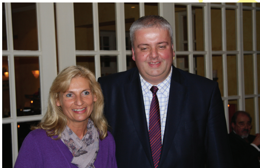
Burkhard Balz MdEP mit der Gastgeberin des Kaminabends der CDU Wedemark, Editha Lorberg MdL.

Im Mittelpunkt seiner Rede schilderte der Europaabgeordnete die Bemühungen, den Euro als gemeinsame europäische Währung zu stabilisieren und die nationalen Haushalte auf den Weg der Entschuldung zu bringen: „Es kommt jetzt darauf an, wieder zu einem starken Europa